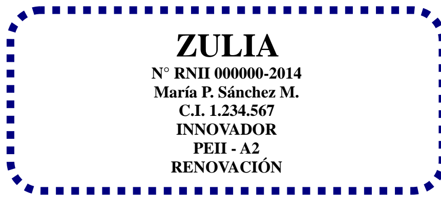
Figura 2. Ejemplo de etiqueta

2.- Utilizar separadores para ordenar la información que aplique según los módulos que contiene la página del RNII. El separador debe preceder la documentación archivada. Recuerda que todos los documentos deben estar impresos en hojas oficiales con logos y sellos húmedos junto a las firmas de los responsables de las instituciones que los emiten. Los documentos deben archivar en orden cronológico. Favor mantener el mismo orden de archivo que se muestra a continuación.